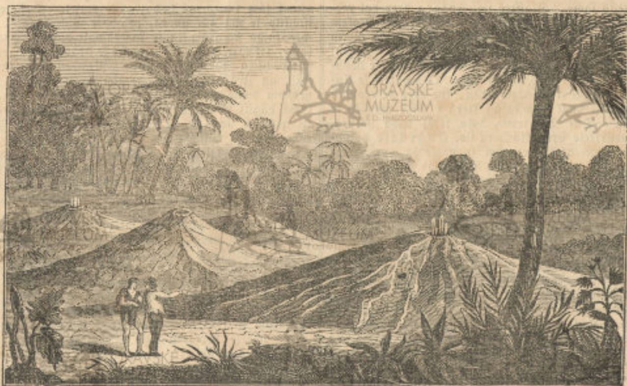
Utuchlé sopky turbacké.

Obráz tento představuje krájinu turbackou v polední Americe, jenž zvláště proto jest pamětí hodná, poněvadž poskytlá nejšednější důkaz náramných baráčenj ve vnitřnostech naší země, ačoli Bladny, Sicilie a Island mnohem výtečnější příklady v tom ohledu nám podávají, a mimo to i nám dostupnější gšau, a to sice Aetna, Vesuv a Weiser.